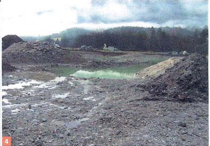
3 Flächensprengung für das Amt der NÖ Landesregierung/Abteilung Flussbau. Hier wurde ein Rückhaltebecken angelegt. Die Sprengung musste ebenfalls mittels spezieller Sprengtechnik durchgeführt werden, da die Bundesstraße, die Freileitung der EVN, ein privates Kraftwerk und ein Gebäude in unmittelbarer Nähe waren 4 Nach glücklicher Flächensprengung

Schwere Zeiten hat sie freilich noch heute. 14 bis 18 Stunden täglich arbeitet Grimus, sechs Tage die Woche.