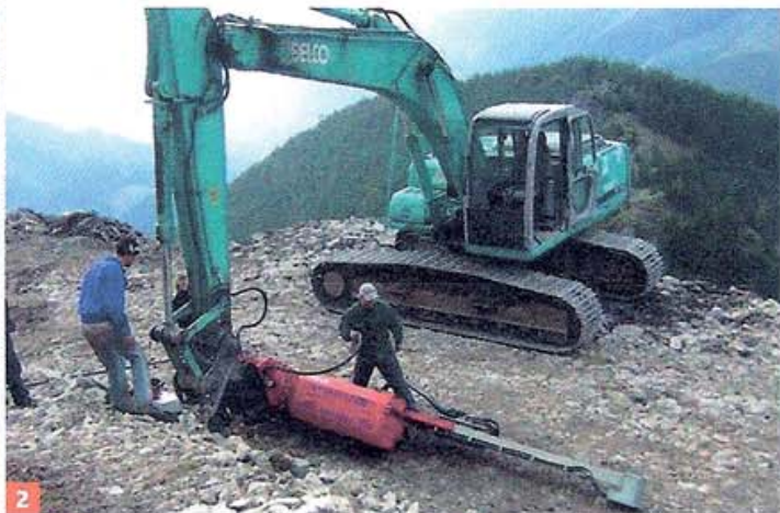
Alte und neue Bohrtechnik. Hier handelt es sich um eine „selbstgebaute“ Bohrlafette (1) und eine Wimmer-Anbaubohrlafette (2). Diese kommen für Sprengungen im Zuge des Forststraßenbaus zum Einsatz

S ie war in ihrem Leben nicht unbedingt auf dem direkten Weg ins Baugeschäft gelangt. Nach Ausbildung zur Zahnarztassistentin, Rezeptionistin in einem Kurhotel, Aufenthalte in Afrika und Chile blieb ihr vor elf Jahren fast nichts anderes übrig, als das Unternehmen weiterzuführen.