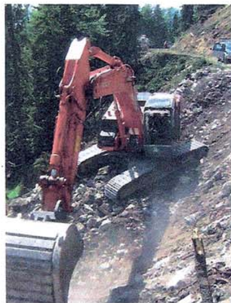
Gestaltung des Forstwegebbaus