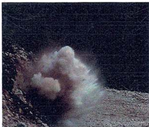
Sprengung für einen künftigen Forstweg

Das Wort Mobbing will sie nicht in den Mund nehmen, aber dass Meldungen, wie „Die Grimus hungern wir aus“, in ihr ein Gefühl der Ungerechtigkeit verursachen, ist unbestritten.